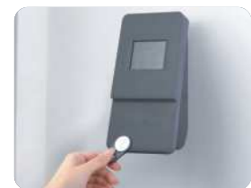
Buchung von Personalzeiten per RFID durch den Mitarbeiter Booking of staff time via RFID by the employer

Companies need to have flexible working times and a correct working time collection for a cost-efficient business. This is ensured by electronic systems for time and attendance as well as access control.