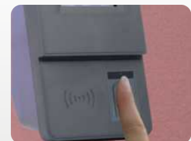
Personalzeitbuchungen mit optionalem Fingerprint. Staff time bookings with optional fingerprint.