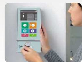
Individuelle Bedruckung der Front am EVO 4.3. Individual printing on the front EVO 4.3.