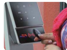
Buchung von Personalzeiten per RFID durch den Mitarbeiter Booking of staff time via RFID by the employer

Companies need to have flexible working times and a correct working time collection for a cost-efficient business. This is ensured by electronic systems for time and attendance as well as access control.