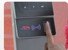
Personalzeitbuchungen mit optionalem Fingerprint Staff time bookings with optional fingerprint.