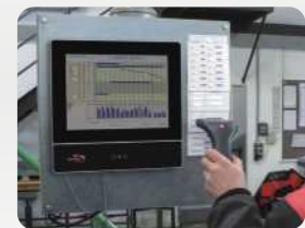
Betriebsdatenerfassung mit externem Barcodescanner. Production data collection with external bar code reader.