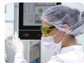
Industrie-PCs der EVO-Line im Einsatz in Industrie und Production. Industrial PCs of the EVO Line in use in industry and production.