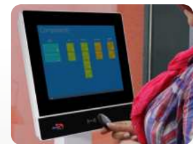
IPC EVO 15 im Einsatz für Personalzeiterfassung. IPC EVO 15 in use for Time & Attendance.

For optimal operations and improvement of cost effectiveness, companies need to have current data, which means the possibility to collect and show local data. This is not only in the office but also in other areas such as canteen, foyer, production, storage and also in production, where a normal PC does not meet the requirements.