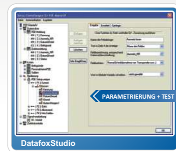
Die Setup-Software | The Setup Software: DatafoxStudio