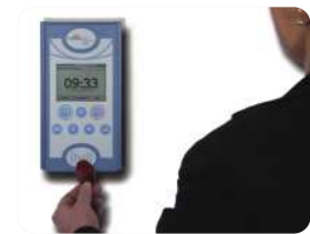
Buchung von Personalzeiten per RFID durch den Mitarbeiter Booking of staff time via RFID by the employer

Companies need to have flexible working times and a correct working time collection for a cost-effective business. This is ensured by electronic systems for time and attendance.