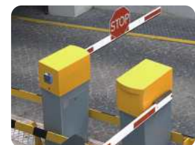
Lösung an einer Schranken-anlage mit Zutrittsicherheit. Solution at a barrier construction with access control.