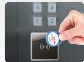
Aufzugsteuerung mit abgesetztem RFID-Leser. Elevator control with external RFID reader.