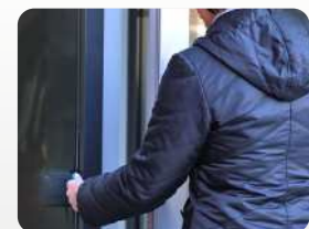
Zutrittskontrolle mit abgesetztem Datafox ZK-Leser. Access control with external Datafox access reader.

Companies need to have more and more flexible working times and the requirement to make the organisation more economic. They also rely that only authorized people can get to respective areas. The knowledge, which person is where, when and how long at a definite place is additionally important. It can be realized by electronic systems for access control.